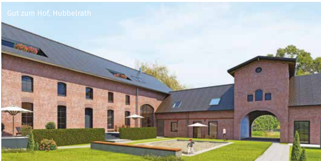
Gut zum Hof, Hubbelrath