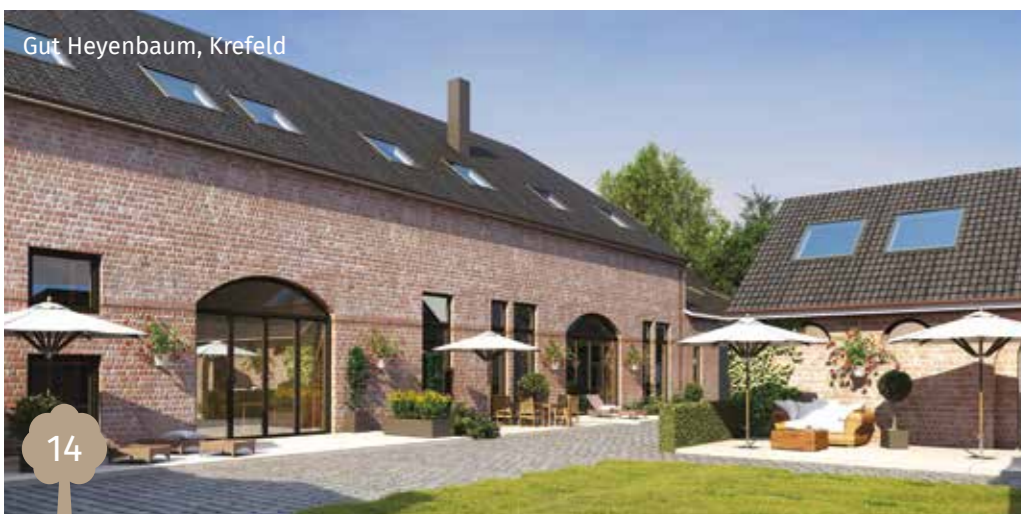
Gut Heyenbaum, Krefeld

Die bau- und denkmalwert und deren Projektgesellschaft restaurieren denkmalgeschützte Objekte und entwickeln Neubau-Projekte in attraktiven Lagen. Daraus entsteht Architektur, die für Käufer und Bewohner gleichermaßen das Besondere verkörpert.